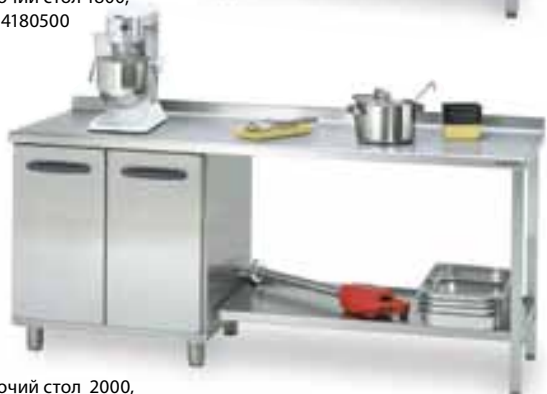
Рабочий стол 2000, код 4180480