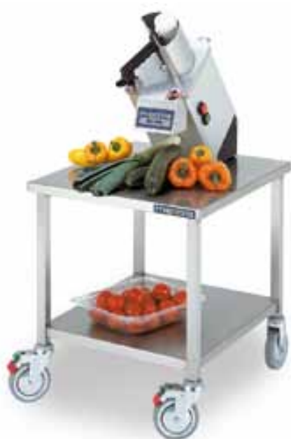
Тележка-подставка Метос (стол-подставка без колес).

Стол-подставка Метос PH-20 предназначен для миксера Беар PH-20. Под столешницей выдвигаемая полка. Прочная конструкция, регулируемые ножки. Полностью из нержавеющей стали.