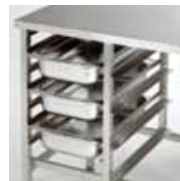
Й-7: направляющие для семи посуд ГН1/1-65