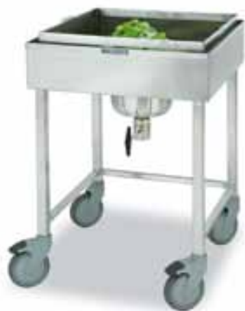
Тележка для мытья салата Метос

Тележка для мытья салата Метос представляет собой идеальное средство для мытья и освежения салатов и других овощей. Ванна высотой 150 мм оснащена проволочной корзиной с ручками. Размеры проволочной корзины позволяют устанавливать ее в ванну тележки и в посудомоечную машину.