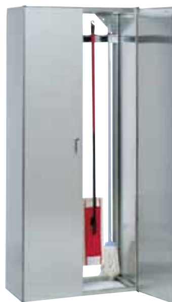
Шкаф для уборочного инвентаря Метос