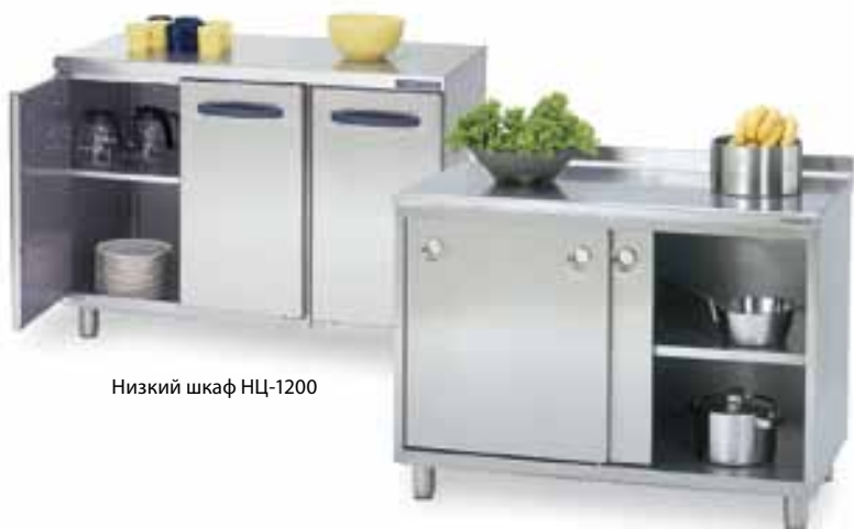
Низкий шкаф НЦ-1200