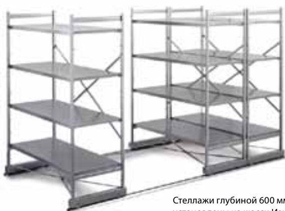
Стеллажи глубиной 600 мм установлены на шасси Изи Райдер 60.