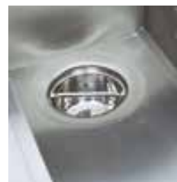
Посуда для сбора остатков с ситом, круглая, легко чистить.