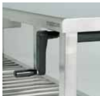
Стол с ручной регулировкой высоты.

При выборе дополнительных принадлежностей учитывайте, что свободное пространство под столешницей равно длине столешницы минус 300мм.