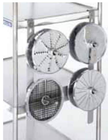
Держатель овощерезательных дисков для тележки, расположенный на тележке с полками Метос СХТ-75.