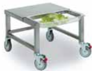
Тележка-подставка Метос PF-350