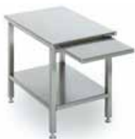
Подставка Метос PH-20