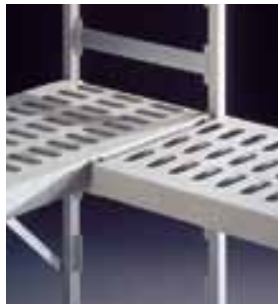
Пластмассовая решетчатая полка. Для всех полок угловой соединитель.