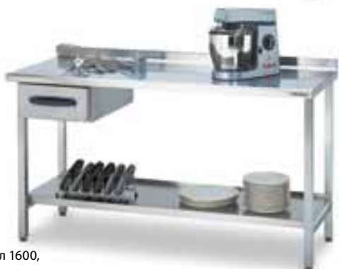
Рабочий стол 1600, код 4180430