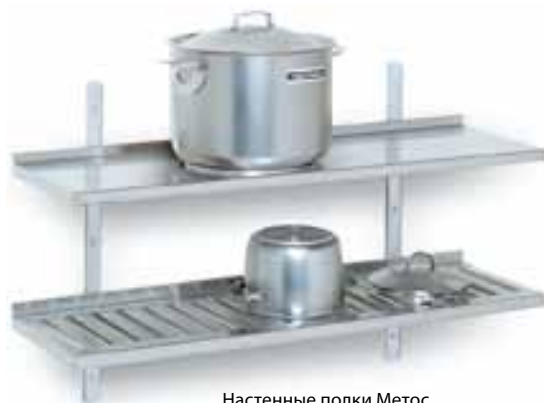
Настенные полки Метос

Подвески и направляющие из анодированного алюминия. Полки из прочной нержавеющей стали. Полка с повышенным задним краем и обработанным передним краем, что улучшает грузоподъемность полки. Промежуток между подвесками определяется согласно применению.