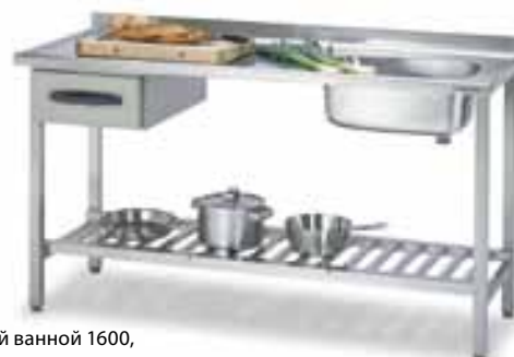
Стол с моечной ванной 1600, код 4180450