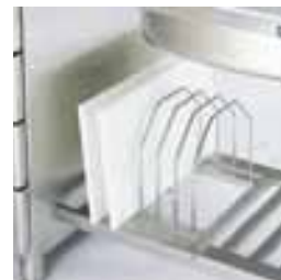
ЛТ: подставка для резательных досок