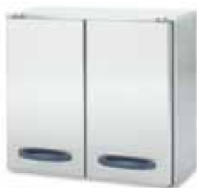
Настенный шкаф ХЦБ-2

Стандартные столы Метос Профф состоят из столешницы и представленных ниже элементов. Стандартная ширина столешницы 650 мм. Вы также можете скомплектовать столы по своему усмотрению, используя стандартные элементы, представленные на следующей странице.