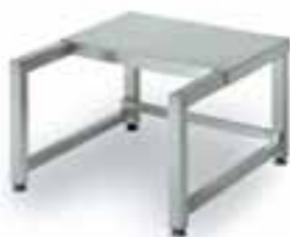
Стол-подставка для овощерезки Метос PF-350