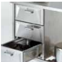
Л-3: блок из трех ящиков, Л-1: ящик под столешницей