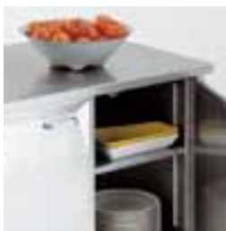
X-1: шкаф 400 мм X-2: шкаф 800 мм