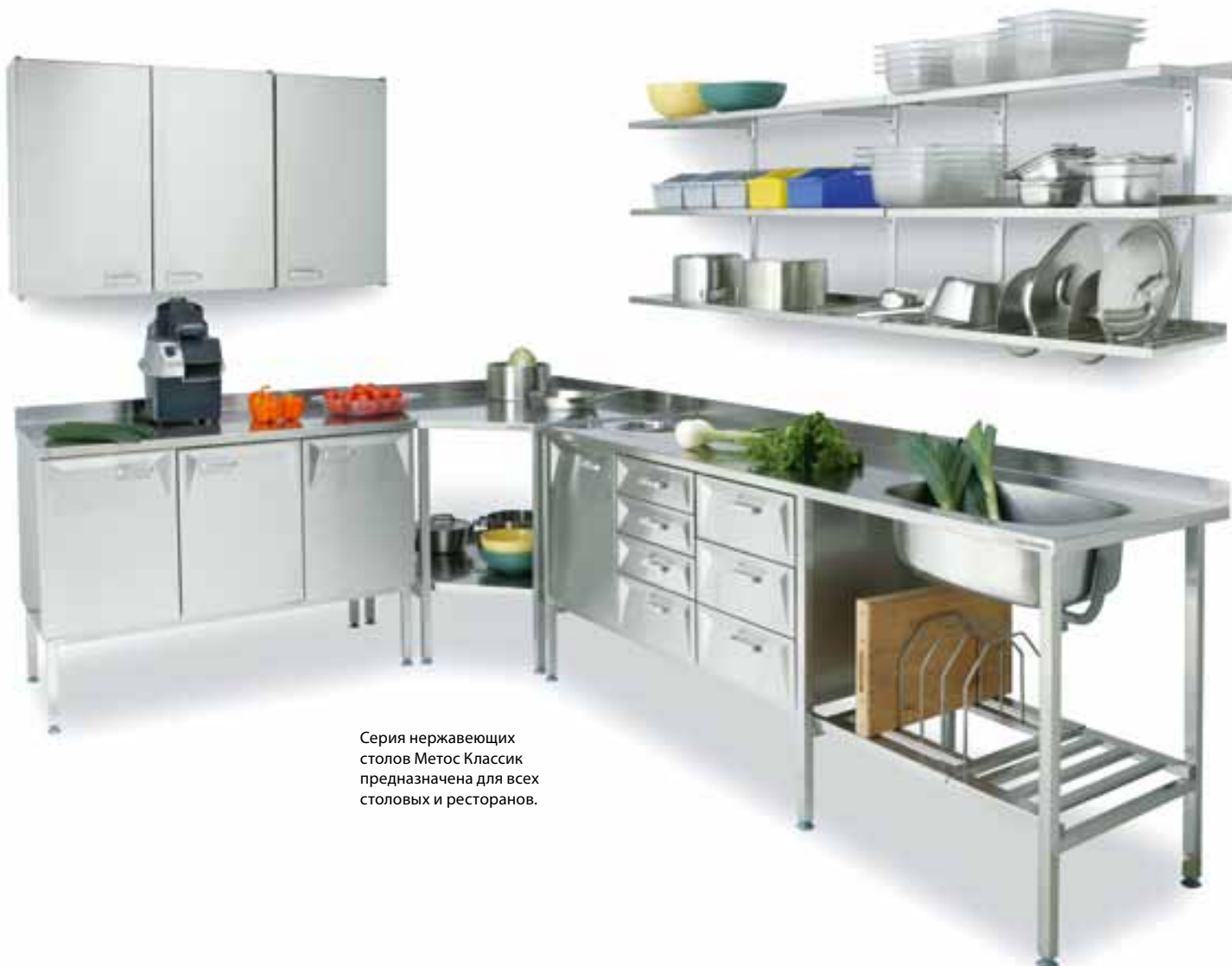
Серия нержавеющей столов Метос Классик предназначена для всех столовых и ресторанов.

М етос Классик представляет собой серию столов, которые изготавливаются по индивидуальному заказу клиента. Конструкция столов из долговечной и легко очищаемой нержавеющей стали.