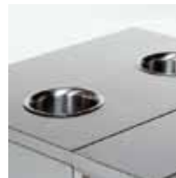
Круглое отверстие с манжетом