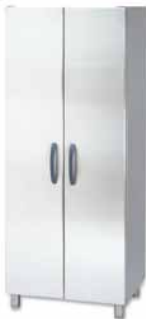
Высокий шкаф ФЦ-2