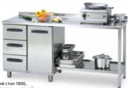
Рабочий стол 1800, код 4180500