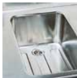
Широкий набор ванн стандартного размера