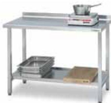
Рабочий стол 1200, код 4180420