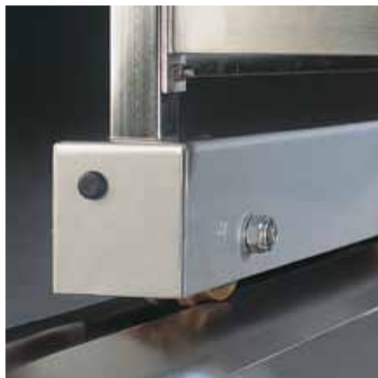
Система мобильных стеллажей Метос Изи Райдер передвигаются по напольным рельсам и экономят свыше 50% складской площади

Для того, чтобы собрать один ряд передвижных стеллажей необходимы две напольные рельсы индивидуальной длины, пластиковые концевые стопоры, шасси с колесами для каждого стеллажа и X-образная нижняя распорка для усиления жесткости каждого стеллажа. Шасси подходят для соединения стеллажей общей длиной до 3 метров. Возможные размеры глубины стеллажей: 600, 800 и 1000 мм. Шасси шириной 800 мм соединяют два стандартных стеллажа глубиной по 400 мм. Шасси шириной 1000 мм – 2 стеллажа по 500 мм. Максимальная длина напольных рельсов – 4000 мм. Более длинное изделие требует заказа дополнительных буферов.