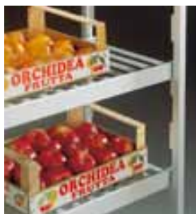
Алюминиевые решетчатые полки. Все колонны позволяют регулировку расстояния полки на 15 см.