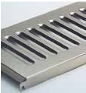
Решетчатая полка из нержавеющей стали. Все полки с быстрым креплением.