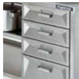
Л-4: блок из четырех ящиков