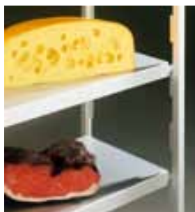
Сплошные полки из нержавеющей стали и алюминия.

способной выдерживать температуру –30 С. Пластиковые полки можно мыть в посудомоечной машине. Распорки крепятся к задним сторонам стоек. Система стеллажей будет очень устойчива, если усилить распорками каждый третий стеллаж. Наши дизайнеры помогут Вам создать Вашу индивидуальную систему хранения.