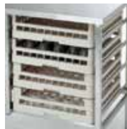
Й-4: направляющие для четырёх кассет