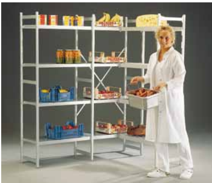
Современная система стеллажей Метос быстро создает индивидуальный стеллаж. Полки и стойки из нержавеющей стали или алюминия. Стеллаж легко переустановить, добавить или переместить на другое место. Монтаж легкий и быстрый, инструмент требуется только для крепления распорки.