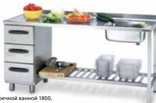
Стол с моечной ванной 1800, код 4180510