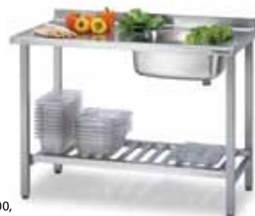
Стол с моечной ванной 1200, код 4180440