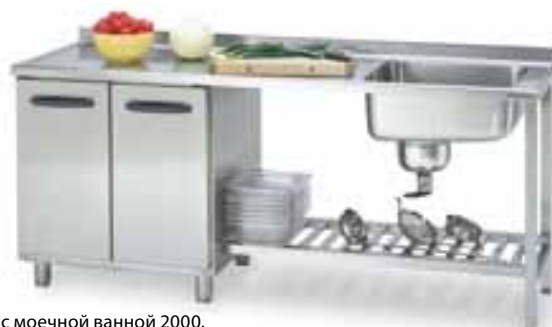
Стол с моечной ванной 2000, код 4180490